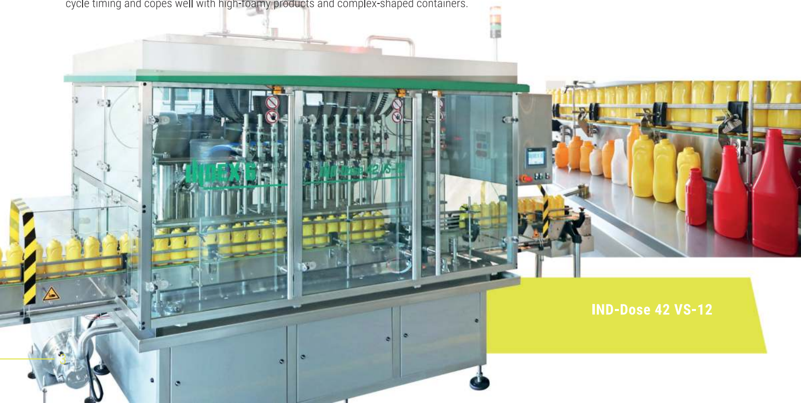
IND-Dose 42 VS-12